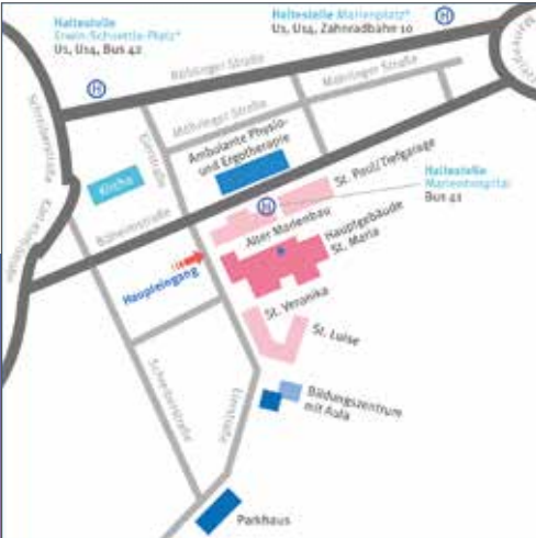
Anfahrt mit Bus und Bahn