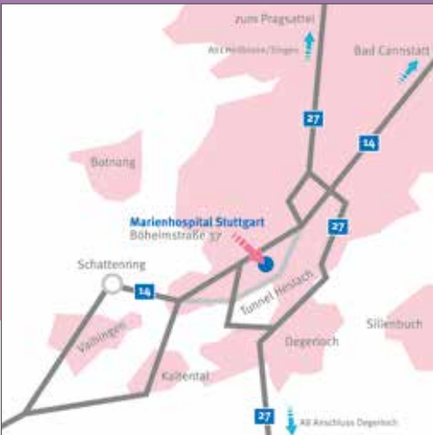
Anfahrt mit dem Auto