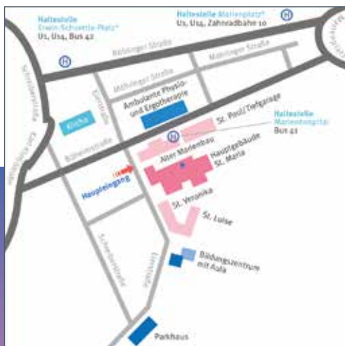
Anfahrt mit Bus und Bahn