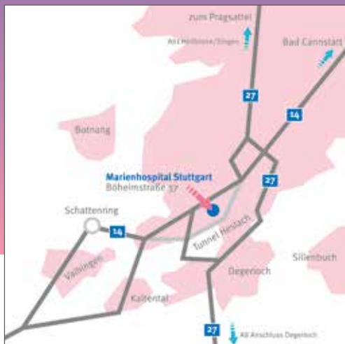
Anfahrt mit dem Auto