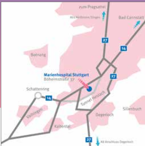
Anfahrt mit dem Auto