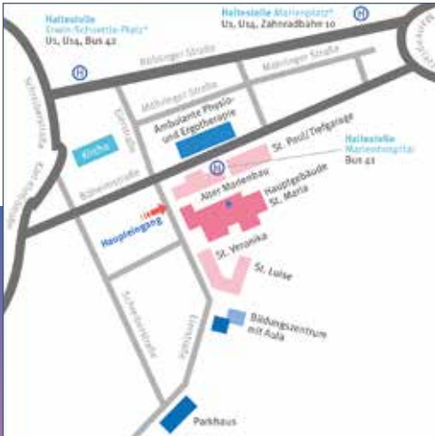
Anfahrt mit Bus und Bahn