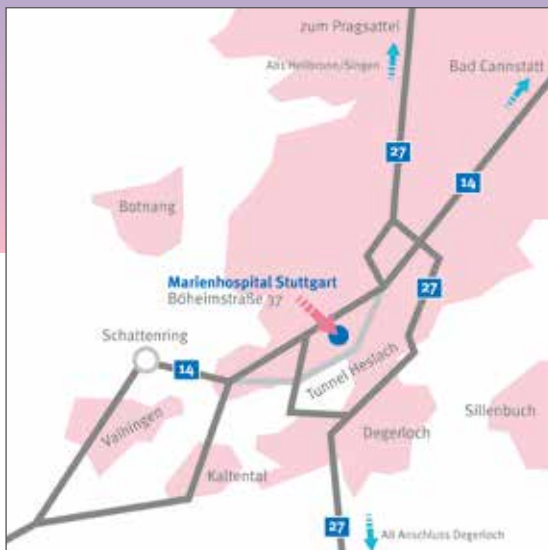
Anfahrt mit dem Auto

Marienhospital Stuttgart Böheimstraße 37 70199 Stuttgart